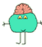
The pink Galileo